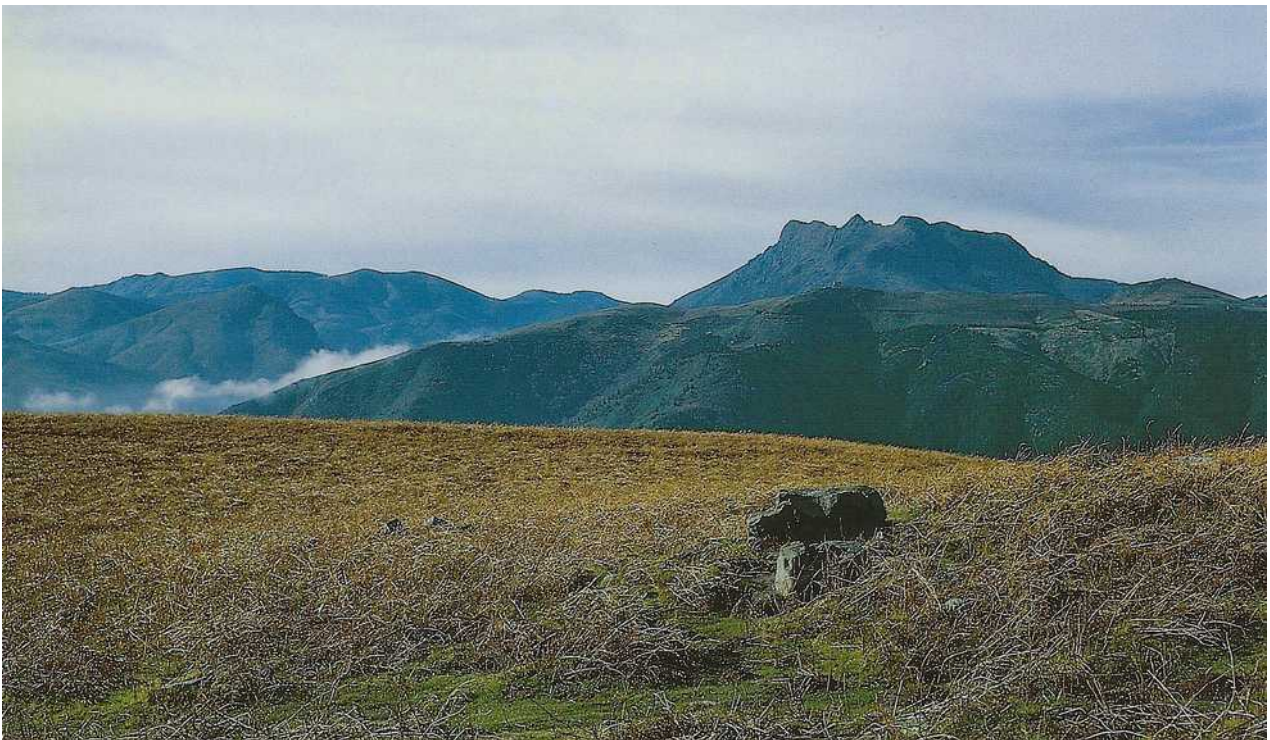
28 – Dolmen de Osin.

Situado al N, se encuentra ligeramente encima del collado de Osin, a la derecha del camino que desciende de Xoldokogaña. Túmulo pedregoso de una decena de metros de diámetro, con una cámara funeraria descentrada hacia el E, completamente demolida, que parece haber sido limitada por cuatro elementos, de los cuales únicamente la gran losa, al O, es perfectamente visible.