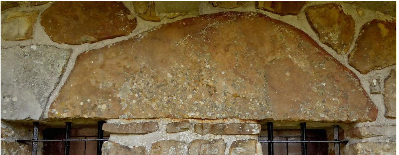
Monolito de Zorrotzarri en la actualidad. Medido el pedazo marrón da 1,58m de largo.