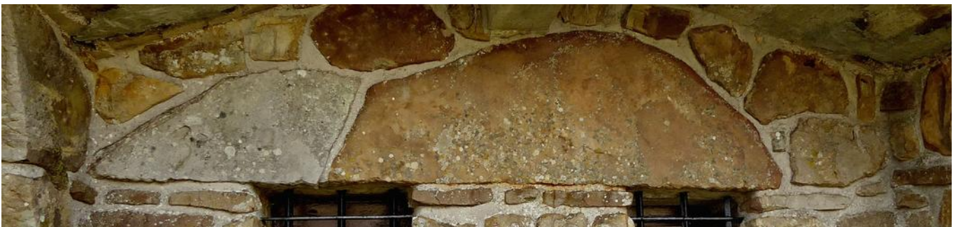
Monolito de Zorrotzarri en la actualidad. Medido entero, el pedazo marrón da 1,58m de largo y con el trozo gris mide 2,35m.

La pregunta es clara y contundente. Si el monolito que parece estar más o menos entero, colocado en el refugio de Perusaroi parece que es el que vieron Aranzadi, Barandiaran y Eguren en 1919.